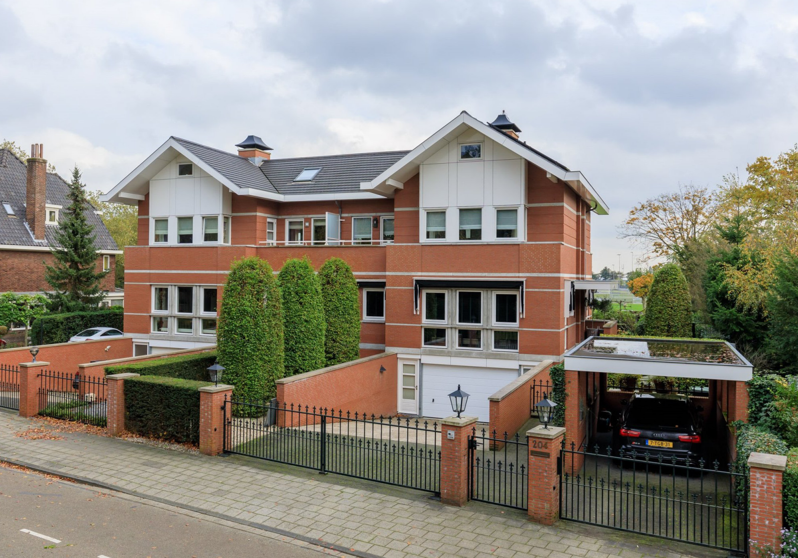
Glipper Dreef 204, Heemstede